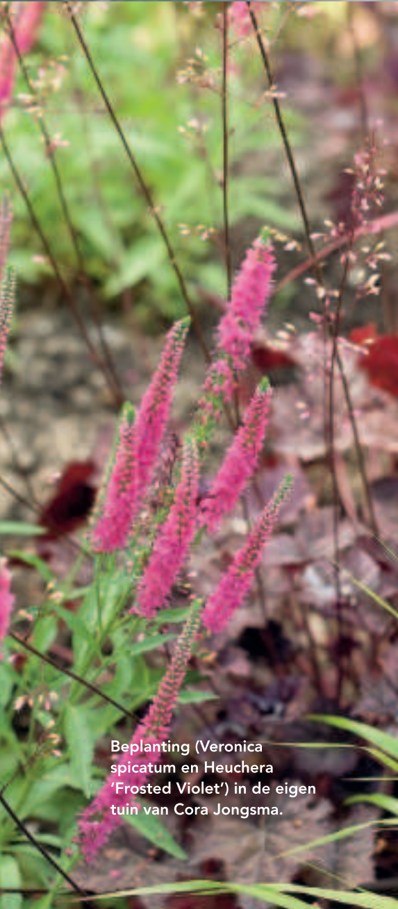
Beplanting (Veronica spicatum en Heuchera 'Frosted Violet') in de eigen tuin van Cora Jongasma.

'Ook datgene waar je op uitkijkt, reken ik tot de tuin. Zelf woon ik op Vinex-locatie Meerpolder in Berkel en Rodenrijs. Vóór het huis ligt een grote plas, omzoomd door hoog riet en omgeven door hijskranen, bouwketen en stukken braakliggend terrein met wuivend gras. Door dat uitzicht heb ik me laten leiden bij de inrichting van mijn tuin. Op ongeveer 20 vierkante meter voortuin heb ik veel hoge grassen geplant. Er liggen gietijzeren roosters, die mooi passen bij het industriële uit de omgeving. De achtertuin telt 70 vierkante meter en is geheel omsloten door schuttingen, een schuurtje en de hoge achterpui van glas. Hier heb ik een hoge pergola geplaatst, die de maatvoering van de ramen volgt en waarmee ik