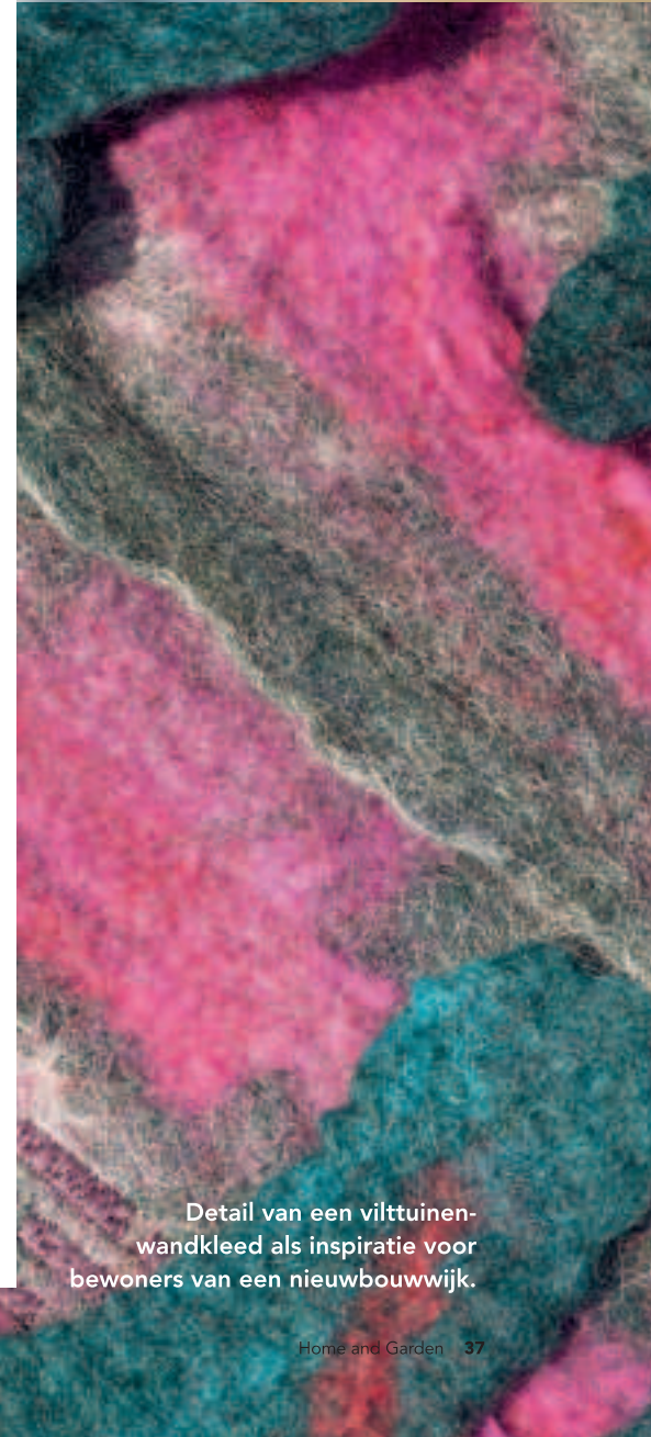
Detail van een vilttuinenwandkleed als inspiratie voor bewoners van een nieuwbouwwijk.