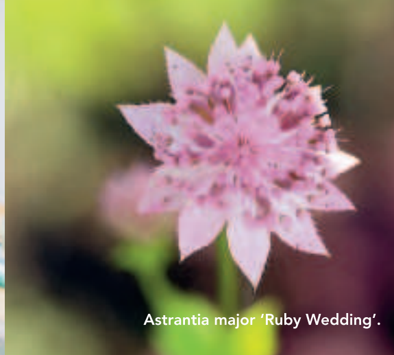
Astrantia major 'Ruby Wedding'.